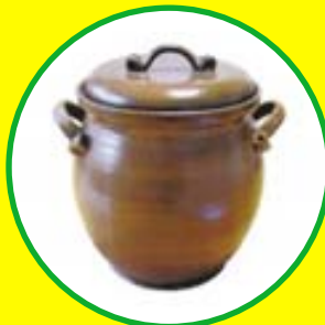
Zeláky od 550 Kč