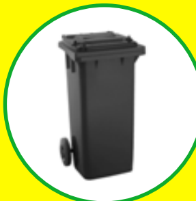
Popelnice od 980 Kč