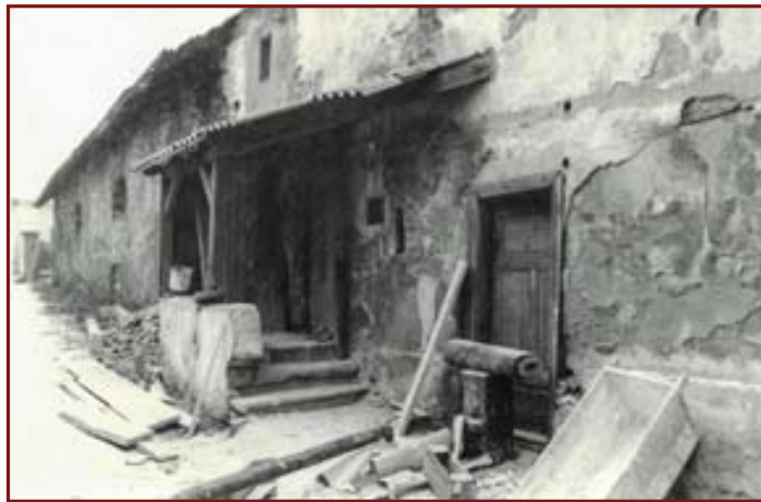
▲ Přestavba začíná