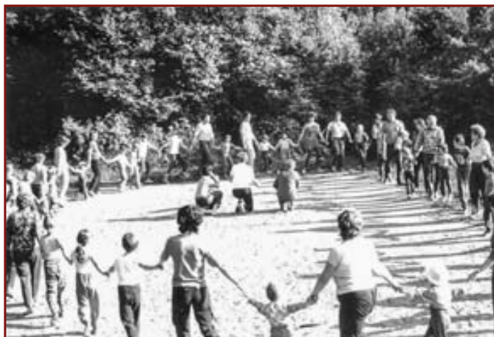
▲ Z činnosti MŠ