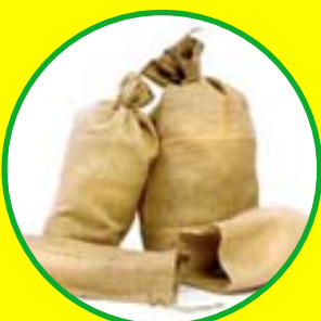
Pytle na brambory od 6 Kč