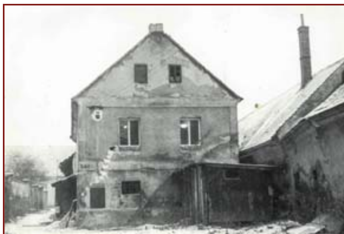
▲ Rekonstrukce pokračuje