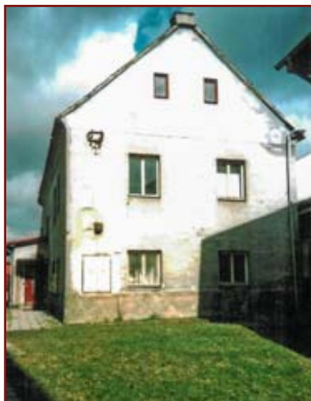
▲ Po opravě, před zbouráním