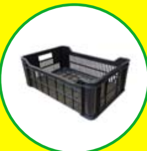
Přepravy a bedny od 105 Kč