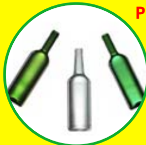
Lahve od 8 Kč