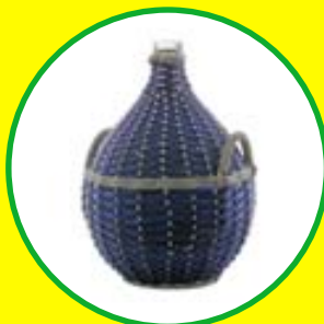
Demžony od 135 Kč