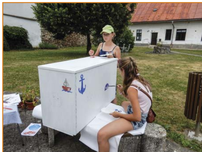
◀▶ Příprava knihovničky na koupaliště