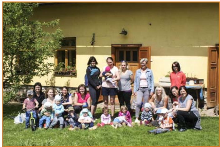
▲ Návštěva kozího dvorku