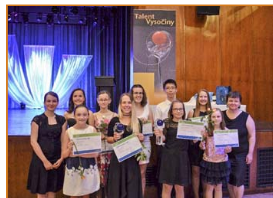
▲ Nominovaní žáci a dva Talenti Vysočiny 2017 ze ZUŠ J. V. Stamicce po slavnostním vyhlášení