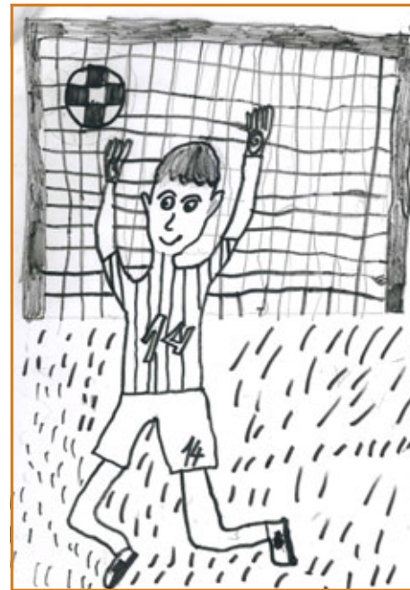
▲ Ilustrace - žák 2. C, ZŠ Přibyslav

(Pozn. redakce: pro velký rozsah byl článek rozdělen, druhá část bude zveřejněna v srpnovém čísle PO)