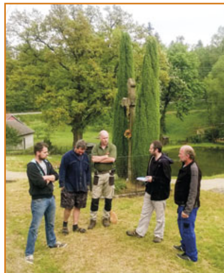
▲ Schůze s osadním výborem v Dobré 24. 5. 2016

Oslavy byly spojeny s poutí a setkáním rodáků. Program byl pestrý a bohatý. Obec vydala fotografickou publikaci a stolní kalendář na rok 2017. V oficiální části byl požehnán prapor SDH Dlouhá Ves. V programu