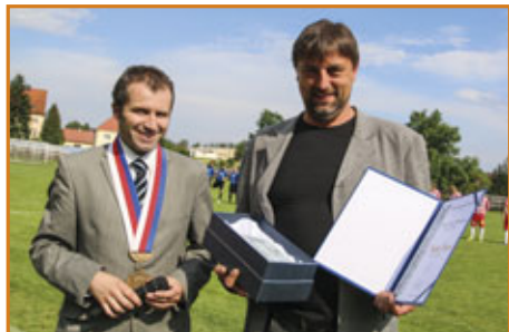
▲ Předání Ceny města Příbyslav

Konec května a červen je období každoročně bohaté na události. Díky práci rozsáhlého počtu dobrovolníků, z jejichž nadšení a nápadů každá z akcí vzniká, jsme mohli být my všichni účastníky bohatého společenského programu. Byly to například: Májový koncert, Houpačka, Běh naděje a Bezpečné prázdniny, výstavy v Janáček galerii, 1000 mil československých, udělení Ceny města, Noc kostelů, či firemní rodinný den v ACO Industries k.s. a dětský den Cukrárny Fontána, jež obohatily konec jara.