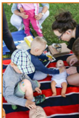
▲ Bezpečné prázdniny, 16.6.2016

návštěva přibyslavského koupaliště setkání – výrobky, písničky, říkadla