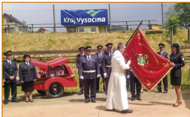
▲ Slavnostní žehnánní praporu SDH Dlouhá Ves při oslavách 760 let od založení obce 4. 6. 2016

MÍSTOSTAROSTA NA RADNICI každé PONDĚLÍ od 14:00 hod. do 16:30 hod.