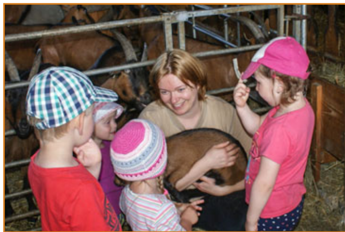
▲ Kozí dvorek Olešenka, 2.6.2016