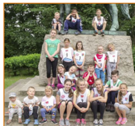
▲ Orientační běh

Podrobné výsledky jednotlivých disciplín, celkové pořadí všech závodníků a spoustu fotek najdete na našem webu a Facebooku.