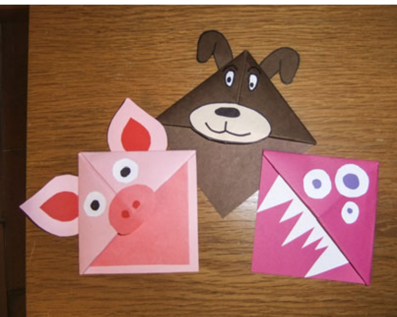
▲ Tvořivé dílničky v knihovně – záložky