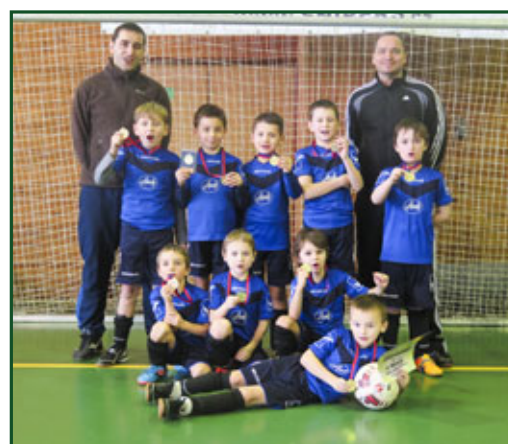
▲ náš tým ročník 2007 a mladší