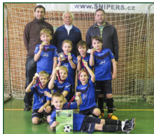
▲ náš tým ročník 2008 a mladší

Nezbývá tak než gratulovat našim fotbalistům za předvedený výkon a skvělou reprezentaci přibyslavského fotbalu. Obstáli v těžké konkurenci i mimo havlíčkobrodský region.