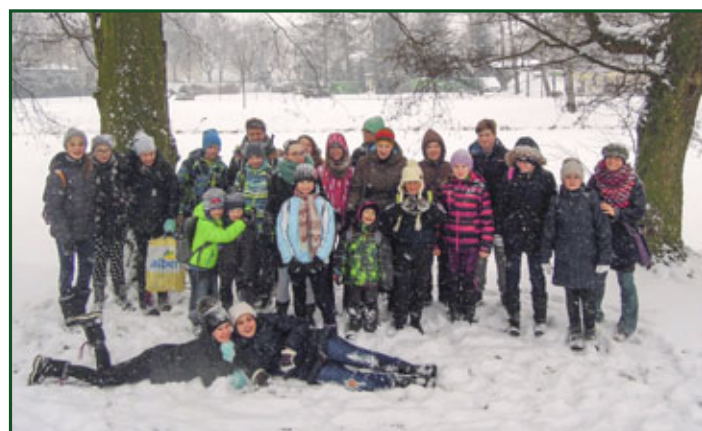
▲ Výlet do Havlíčkova Brodu