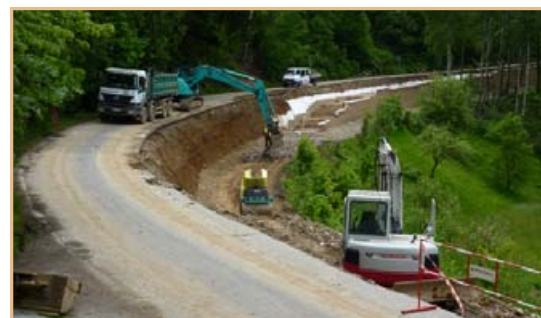
▲ Zpevňování svahu silnice v Dobré