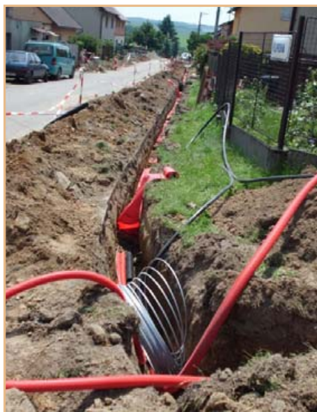
▲ V ulici Filipova