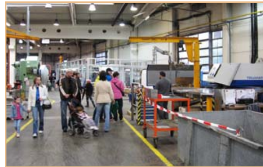
▲ Oslavy 20 let Aco v Přibyslavi