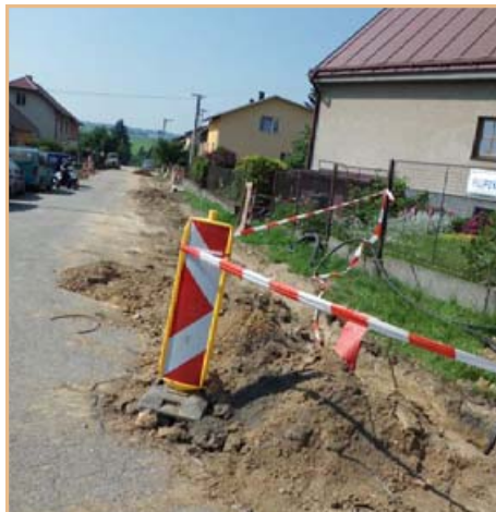
▲ Akce společnosti ČEZ, a.s.