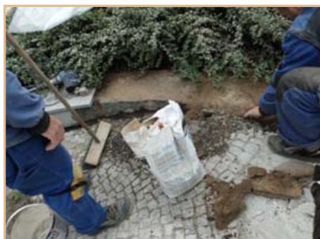
▲ Oprava schodů za radnicí