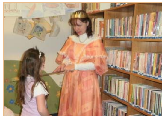
▲ Z pasování prvňáčků na čtenáře