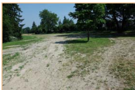
▲ Vyčištění hřbitova