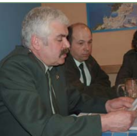
▲ Z výroční schůze MS Přibyslav – předseda čte výroční zprávu