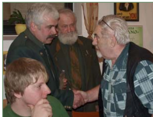
▲ Z výroční schůze MS Přibyslav – blahopřání k jubileu