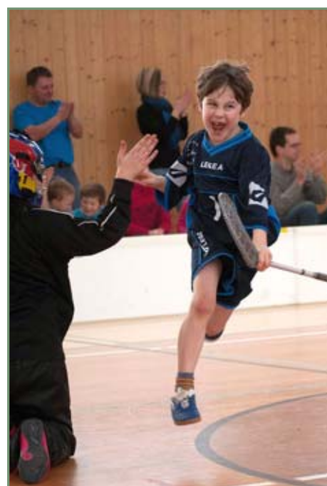
▲ Z uplynulé florbalové sezóny