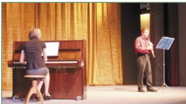
▲ Z koncertu žáků