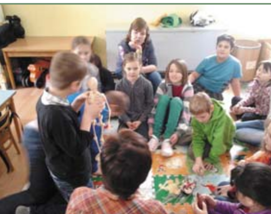
▲ Schůzka ČČK v domečku v Harmonii