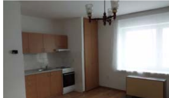
▲ Byt č. p. 40 na Bechyňově náměstí před a po rekonstrukci