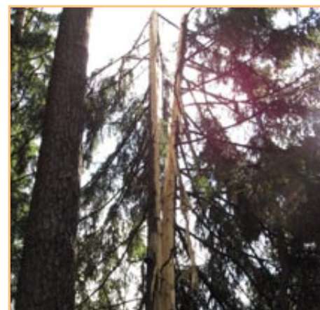
▲ U cyklostezky po bouře