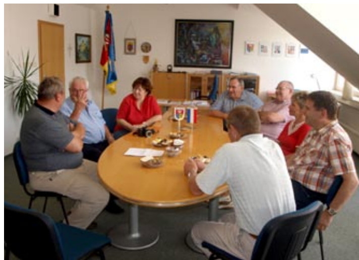
▲ Přijetí vzácné návštěvy na radnici