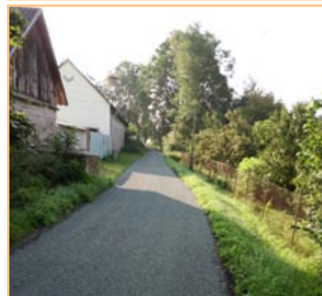
▲▲▲ Exkurze za přibyslavskými chodníky