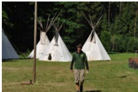
▲ Tábor, kde se z chlapců stávají chlapci