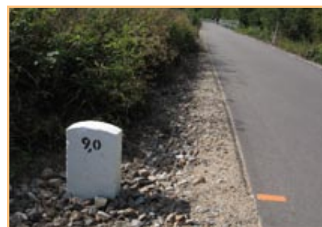
▲ Cyklostezka má nové kilometrovníky