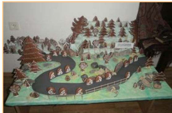
▲▲▲ Z výstavy Svět v malém