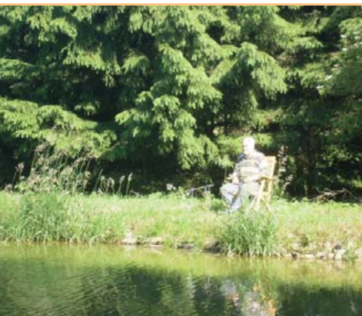
▲ ... a tak to táhne k vodě...