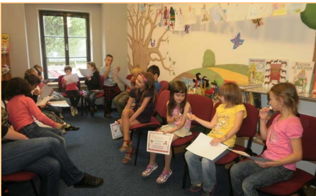
▲▲▲ Pasování prvňáčků na čtenáře