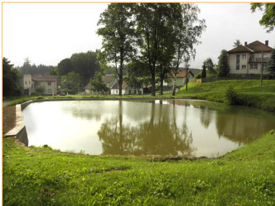
▲ Společná práce občanů Dolní Jablonné a její výsledek