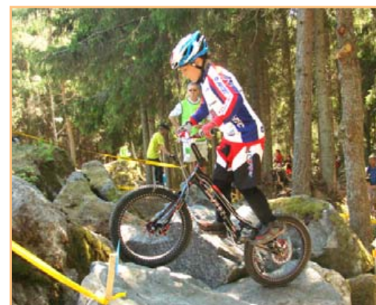
▲ ... a na trati závodu