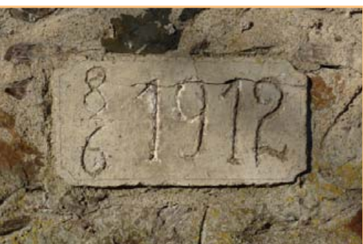
▲ Nedávné kulatiny jedné přibyslavské zdi