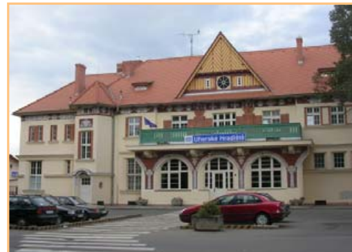
▲ Vítěz loňského ročníku – nádraží Uherké Hradiště

Právě probíhá nominace návrhů 6. ročníku soutěže o titul