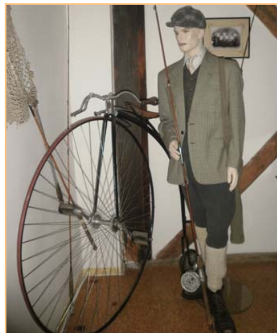
▲▲▲ Z exponátů přibyslavského muzea