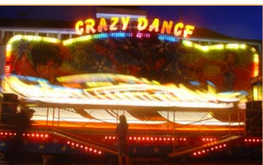
▲ ... a všemi směry za zábavou a odpočinkem...