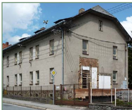
▲ Rekonstrukce mateřské školky