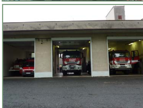
▲▲▲ Den otevřených dveří v hasičské zbrojnici

(Pokračování Usnesení zastupitelstva města Přibyslav ze str. 5)