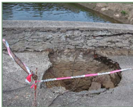
▲ Další rána ronovského mostu