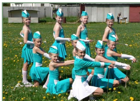
▼ Z dopravního dopoledne