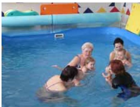
Plavání dětí a kojenců

Chcete nás podpořit? číslo účtu: 2767340237/0100 KB, var. symbol: 90 Děkujeme!