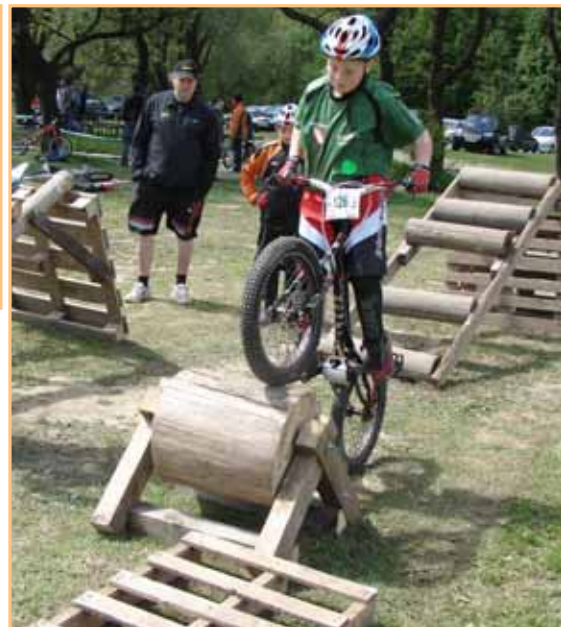
Atletická část soutěže v sokolské všestrannosti