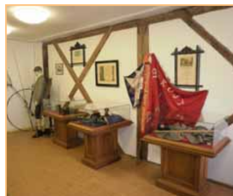
Z nově otevřené expozice přibyslavského muzea