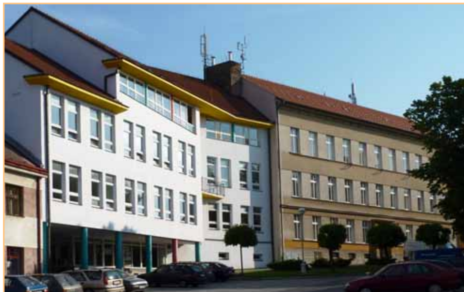
Základní škola Přibyslav