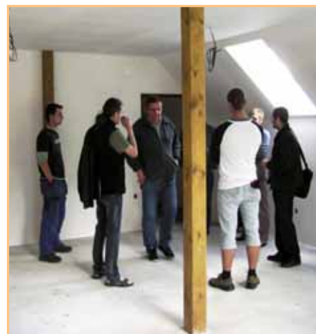
Kontrolní den – hasičská zbrojnice Dobrá