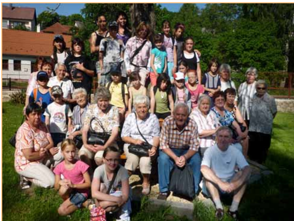
Senioři společně s dětmi na výletě