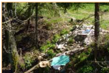
Smetiště v okolí města