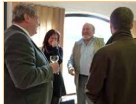
Z vernisáže obrazů krajináře J. Kreibicha