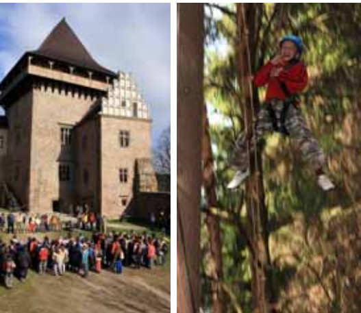
Ze Svojsíkova závodu