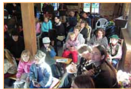
Festivaly ve Dvorku