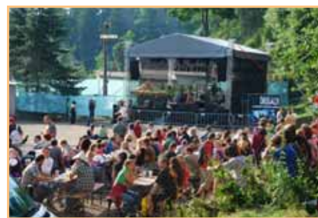
Šatlava fest

Vstupenky na Šatlava fest jsou už nyní k dispozici v před-